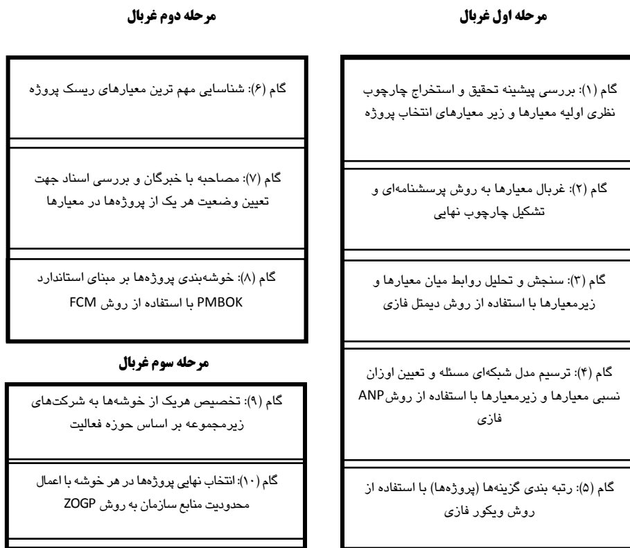
شکل ۱ فرآیند اجرای پژوهش

تصمیم‌گیرندگان معمولاً در فرآیند تصمیم‌گیری با ابهامات، تردیدها و عدم قطعیت مواجه هستند. برای رفع ابهام و ذهنی بودن قضاوت تصمیم‌گیرنده و همچنین بیان واژه‌های کلامی در فرآیند تصمیم‌گیری، نظریه فازی مطرح شد [۲۵]. بر این اساس، پژوهش‌های فراوانی در این خصوص انجام گرفته است، اما تعداد بسیار کمی از این مطالعات قادر به انعکاس ابهامات موجود در تفکرات و تصمیمات کارشناسان هستند. از آنجاکه منطق فازی دلالت بر تفسیر شرایط مبهم و تصمیم‌گیری در شرایط عدم قطعیت دارد، لذا پژوهش حاضر درصدد پر کردن شکاف مزبور با ارائه روش‌شناسی مبتنی بر فنون تصمیم‌گیری چندمعیاره تحت شرایط عدم قطعیت است. همچنین جهت