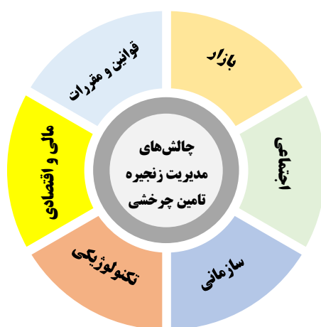
شکل ۲. مدل مفهومی چالش‌های پیاده‌سازی مدیریت زنجیره تامین چرخشی

با استفاده از کدهای استخراج شده و مصاحبه و نظرخواهی از خبرگان، در نهایت ۳۳ کد در قالب ۶ بعد دسته‌بندی شد که مدل مفهومی تحقیق در شکل ۲ قابل مشاهده است.